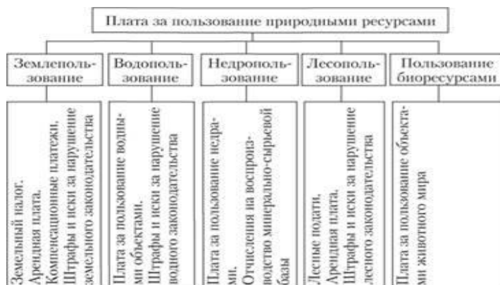
Рис. 10.8. Структура платы за природные ресурсы