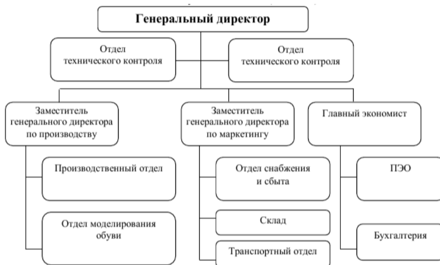
Рисунок – Организационная структура анализируемого предприятия